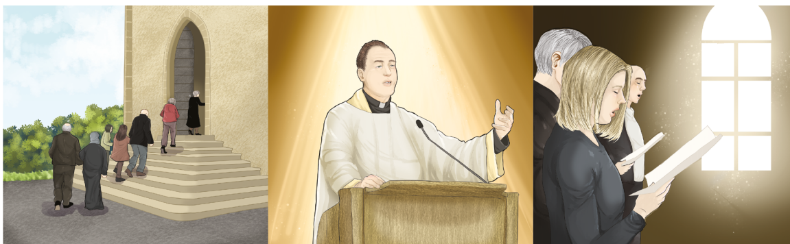
Jag går in i kyrkan.